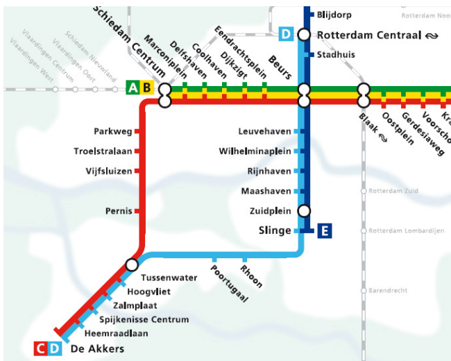
Overzicht metrolijnennetwerk Rotterdam

zie ook: http://www.rotterdam.nl/overzicht_openbare_parkeergarages_