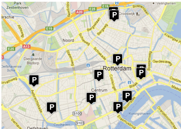
Overzicht parkeergarages Rotterdam

zie ook: http://www.rotterdam.nl/overzicht_openbare_parkeergarages_